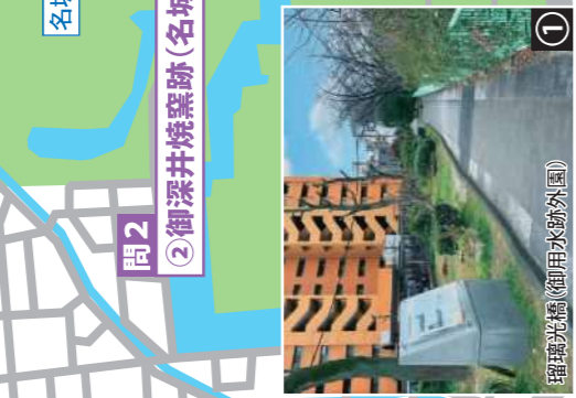
① 瑠璃光橋(御用水跡街園)