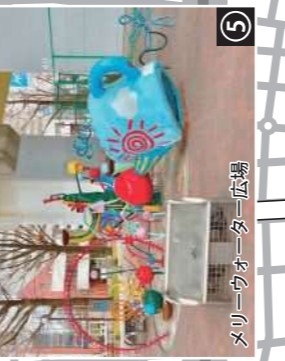
⑤ メリーウォーター広場