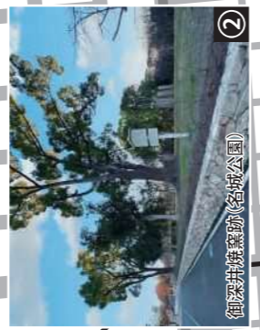
② 御深井焼窯跡(名城公園)