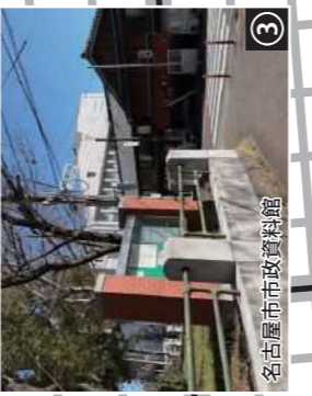
③ 名古屋市政資料館