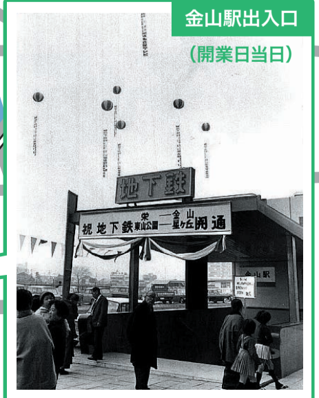
金山駅出入口 (開業日当日)