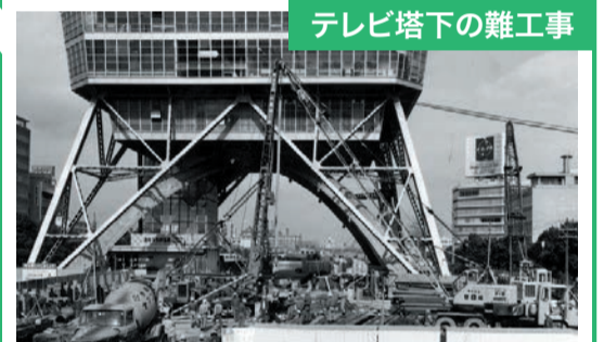
昭和29年に開業したテレビ塔(高さ180m、総重量3,300t)の塔脚の間を南北にくぐって、地下トンネルを作る工事は、当時国内外で前例のない難工事でした。