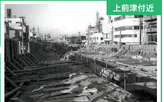
栄方面に向かって撮影