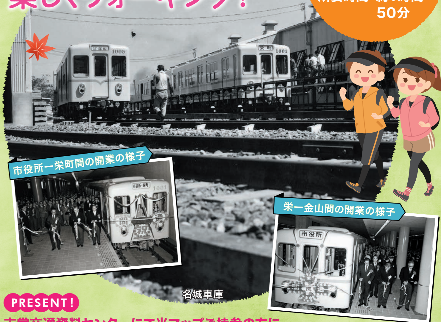
市役所一栄町間の開業の様子

スタート:市役所駅 ゴール:金山駅 距離:約7.0km 所要時間:約1時間 50分