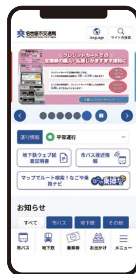
交通局ウェブサイト トップページ

さらに、音声読み上げソフトへの対応を改善し、英語・中国語（簡体字・繁体字）・韓国語・ポルトガル語・スペイン語・フィリピン語・タイ語・ベトナム語の9言語への自動翻訳機能を導入するなど、アクセシビリティを向上しました。