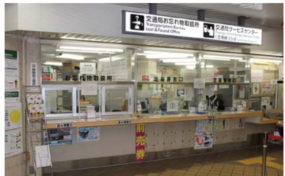
交通局お忘れ物取扱所

営業時間 9時～20時 （12月31日、1月3日は10時～17時） 休業日 1月1日・2日