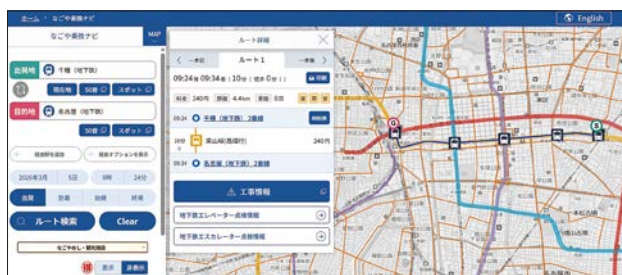
「なごや乗換ナビ」検索経路のルート表示