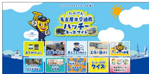
交通局ハッチキッズサイト トップページ

市バス・地下鉄の乗り方やきっぷの買い方を画像やイラストと共に紹介する「おでかけしよう」や車両を動画と写真で紹介する「図鑑で学ぼう」、実際の映像を使った地下鉄運転シミュレーター「きみも地下鉄運転士」など、楽しみながら学べるコンテンツを公開しています。