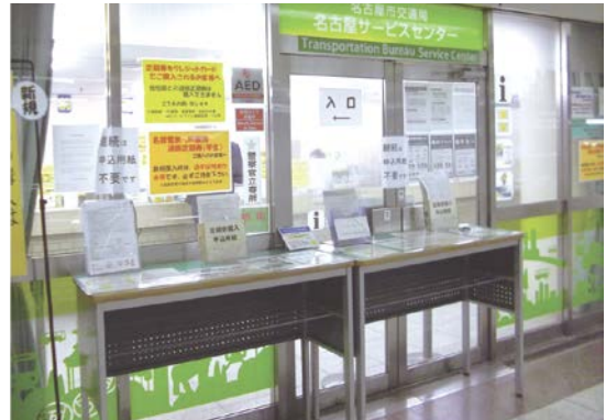
交通局サービスセンター（定期券うりば）

定期券をはじめ、各種乗車券を販売しています。 名古屋駅、栄駅、金山駅の3か所で営業しています。