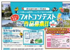
作品募集ポスター