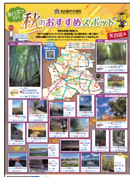
お出かけ情報ポスター