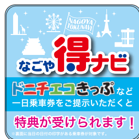
なごや得ナビ提携店ステッカー

また、外国人観光客向け情報の充実を図るため、「なごや得ナビ」の英語版冊子を発行し交通局ウェブサイトに掲載しています。