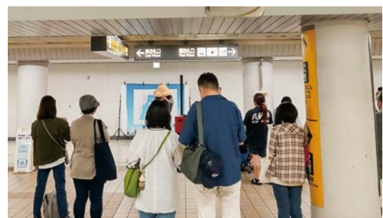
Nagoya POP UP ARTIST